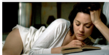
Culture: Notre agenda de la semaine